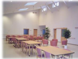
食堂・機能訓練室

私達の施設は、利用者様の皆様に「明るく」「元気で」「楽しく」お過ごしいただくお手伝いをさせていただきます。 ご利用者様、ご家族様の社会的孤立感の解消、経済的負担の軽減等を考慮し、多床室(4人部屋)中心の施設に致しました。